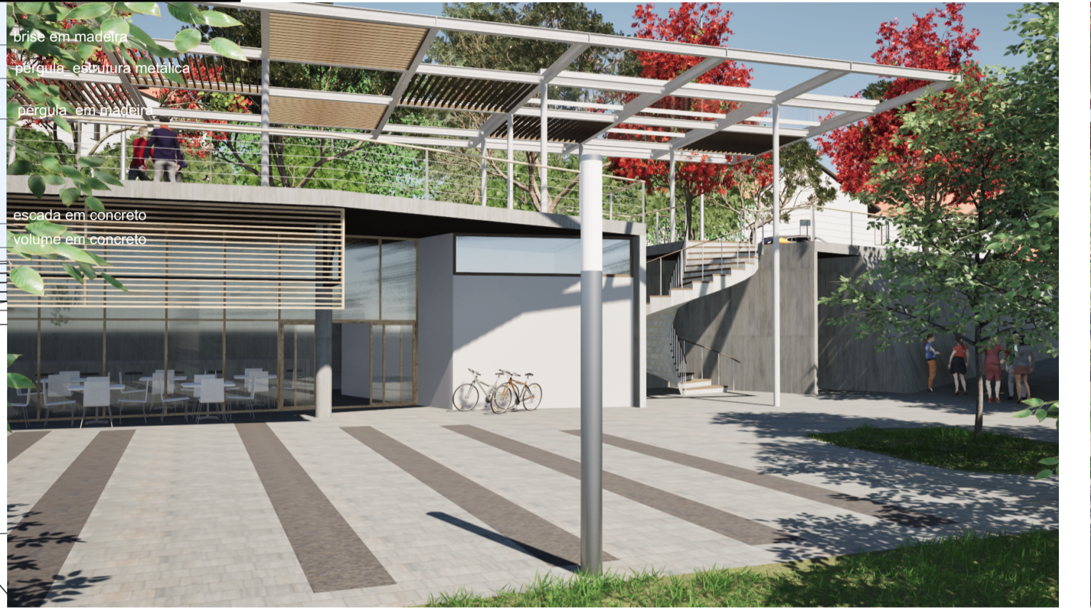
vista rampa acesso