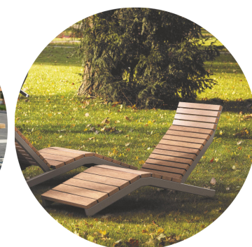
Assento em ripas de madeira maciça | estrutura de aço galvanizado | pintura eletrostática a pó