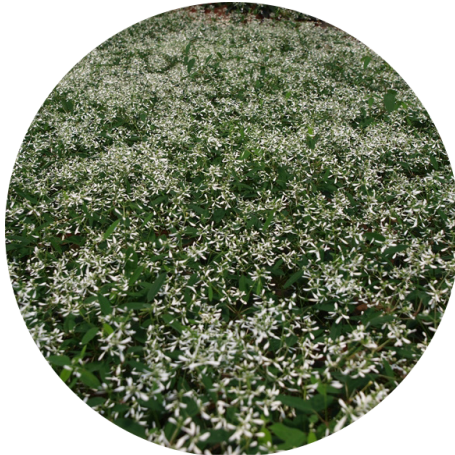
Eufóbia hip hop - Euphorbia hiphop