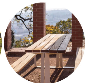
Fechamentos em ripas de madeira maciça | estrutura de aço galvanizado | pintura eletrostática a pó