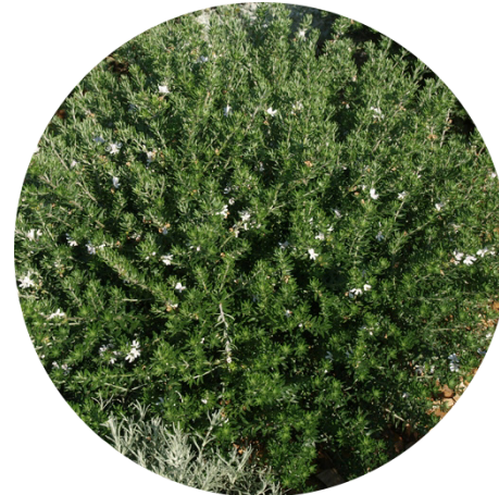
Alecrim-australiano Westringia fruticosa