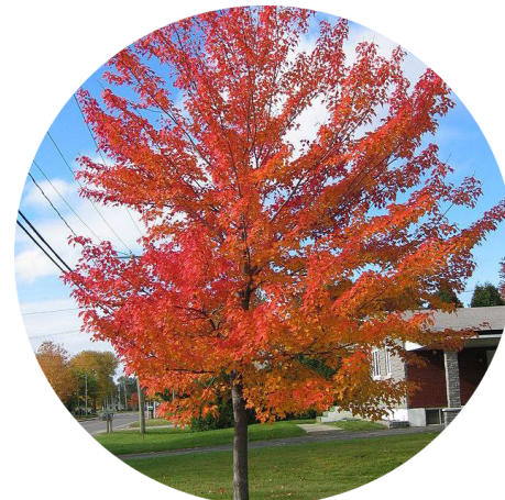
Acer - Acer rubrum