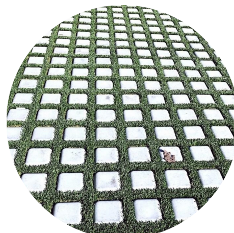
Congregrama | Estacionamento