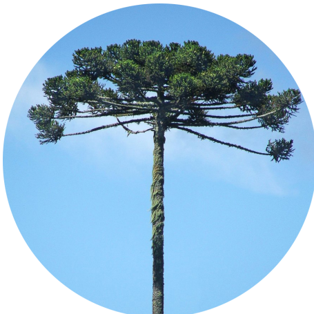
Araucária - Araucaria angustifolia