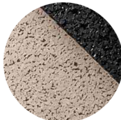
Piso EPDM Bege | Playground