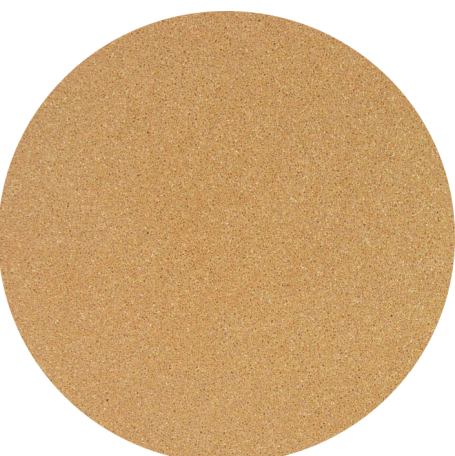
Fulget pigmentado | Caminhos