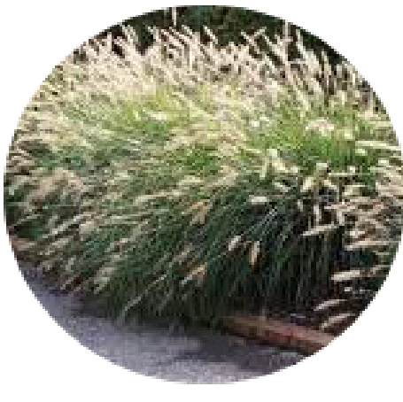
Capim do texas Pennisetum setaceum