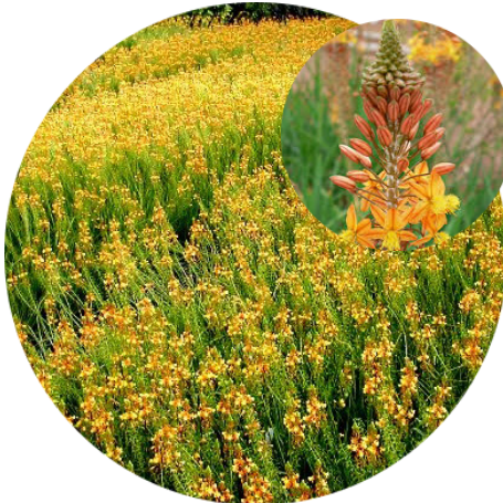
Bulbine - Bulbine frutescens