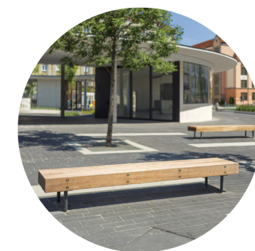
Assento de placas de madeira maciça | pernas de aço galvanizado | pintura eletrostática a pó.