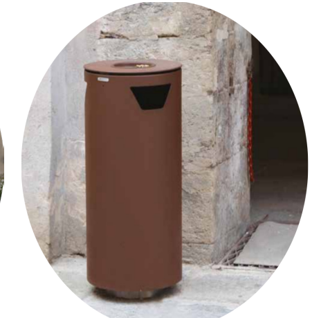
Lixeira em formato cilíndrico de aço pintado a pó com tampa do mesmo material.