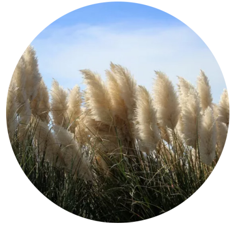
Capim dos pampas Cortaderia selloana