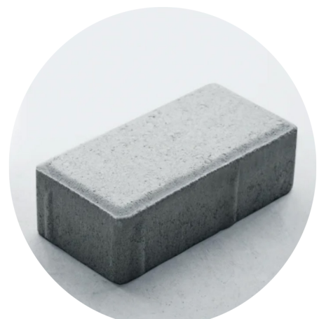
Paver cinza | Leito viário