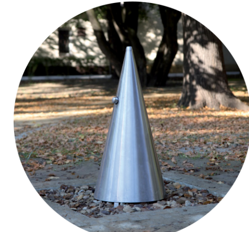
Estrutura cônica em aço inoxidável