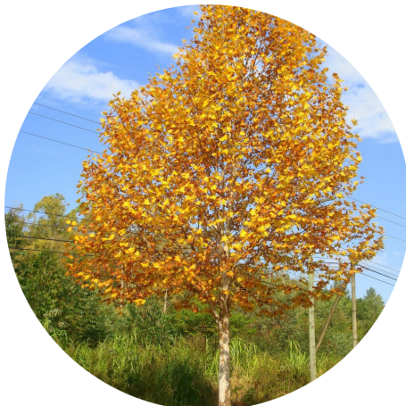
Plátano - Platanus acerifolia