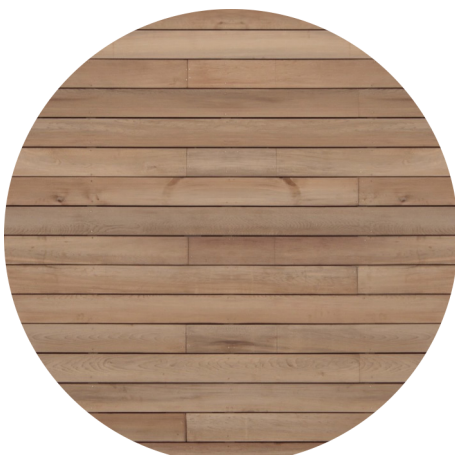
Deck Itaúba | Ateliê e anfiteatro