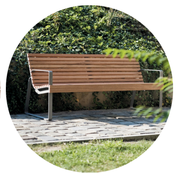
Assento em ripas de madeira maciça | estrutura de aço galvanizado | pintura eletrostática a pó