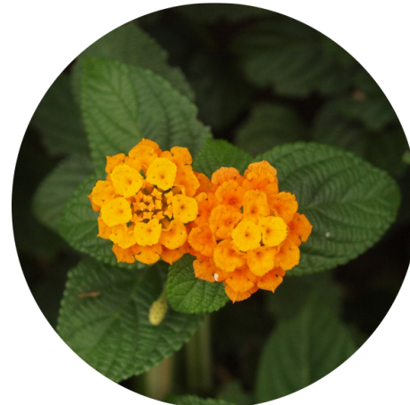
Lantana laranja - Lantana camara