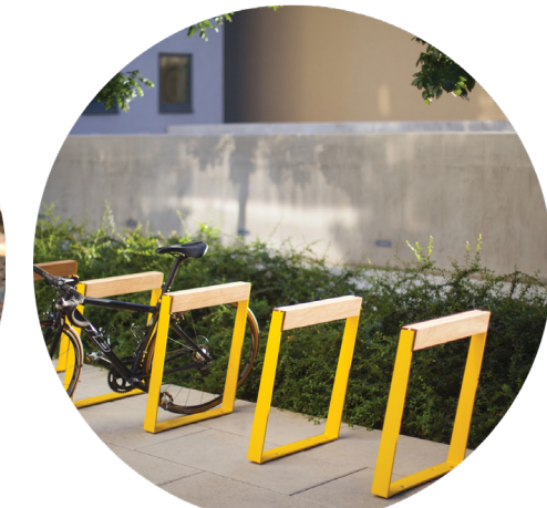
Estrutura de aço galvanizado com pintura eletrostática a pó, com lâmina superior horizontal em madeira maciça.