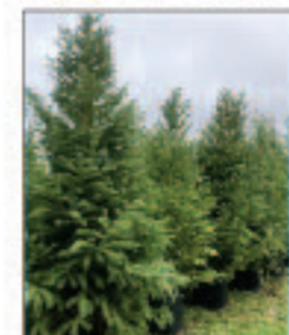
pinheiro alemão Cunninghamia lanceolata retirar espécimes danificados e replantar

preservar identidade do jardim europeu replantando espécimes danificados e introduzindo novas espécies