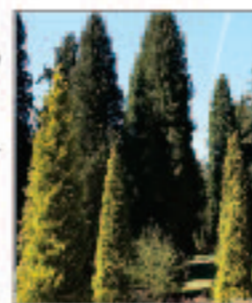
cryptoméria elegans retirar espécimes danificados substituindo por Chamaecyparis aurea , Alumii e Cupressus stricta sempervirens

colorir a paisagem com cores outonais introduzindo